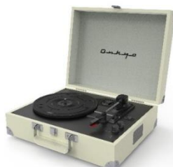
【OCP-01(W)ヴィンテージホワイト】