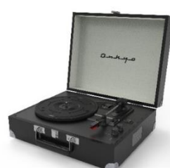
【OCP-01(B)ミスティックブラック】