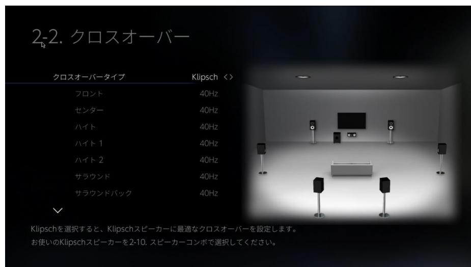
AV レシーバーのクロスオーバー設定の UI 画面

Klipsch Optimized Mode は、今後の当社 AV レシーバー新製品に随時搭載して予定であり、Klipsch の Reference シリーズの新製品が発売されれば、順次アップデートにて追加対応していく予定です。