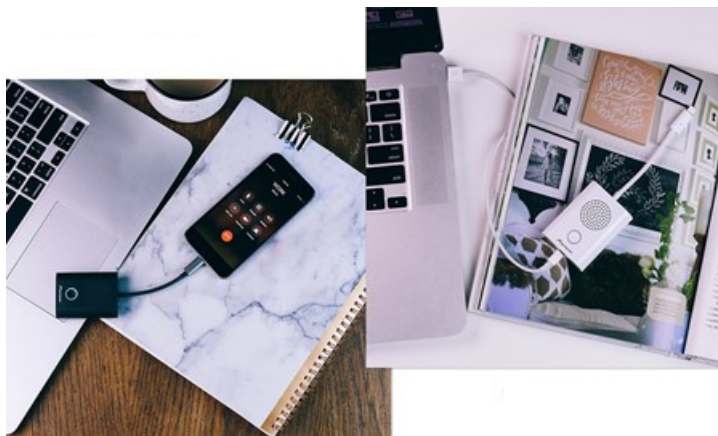
RAYZ Rally はパソコンにも接続でき、テレワーク用マイク&スピーカーとして最適

カンファレンススピーカー “RAYZ Rally”は、特に米国において、2020年に対前年225%の出荷台数と好調に推移いたしました。コロナ禍での在宅勤務時にPlug&Playのシンプルな使い勝手とパワフルなオーディオツールだという点が評価されたこと、米国の医療施設でのモバイルデバイスによる言語翻訳サービス用のオーディオサポートデバイスとしてB2B用途で広く採用されたことが理由です。