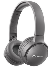
S6wireless noise cancelling

現在、パイオニアブランドの商品に加えて、新たなオンキヨーブランドのヘッドホン・イヤホンも近日発表の準備を進めており、準備が整い次第順次発表いたします。