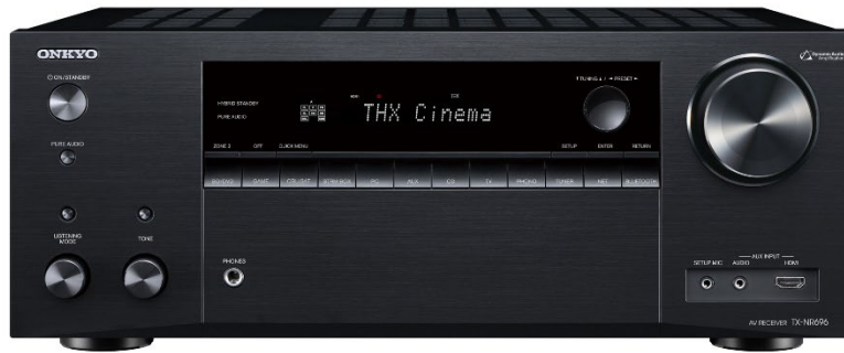
AKM 製 DAC 採用 AV レシーバー TX-NR696